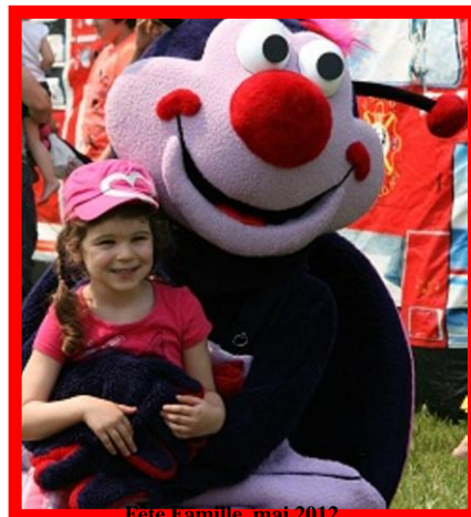
Fete Famille, mai 2012