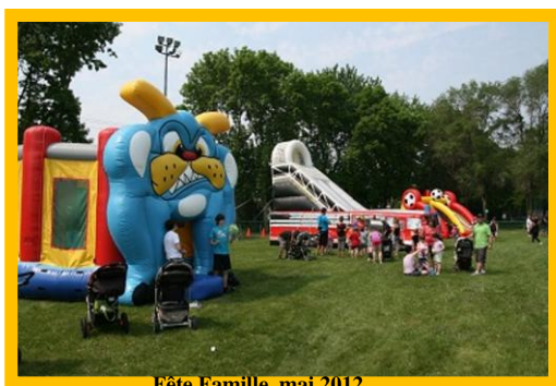
Fête Famille, mai 2012

Près de trois mille (2 500) personnes ont participé à la fête.