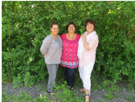
Soutien dans la communauté