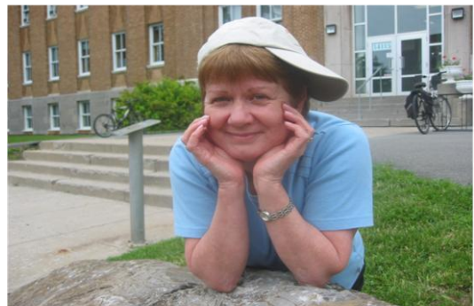
En 17 ans de travail à l'Alpha, la seule chose que j'ai réussi à mettre de côté c'est la palette de ma casquette !!!!